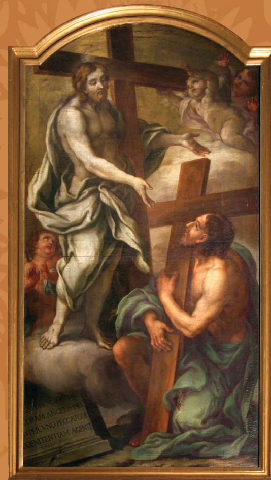
PIARISTA RENDHÁZ, VÁC